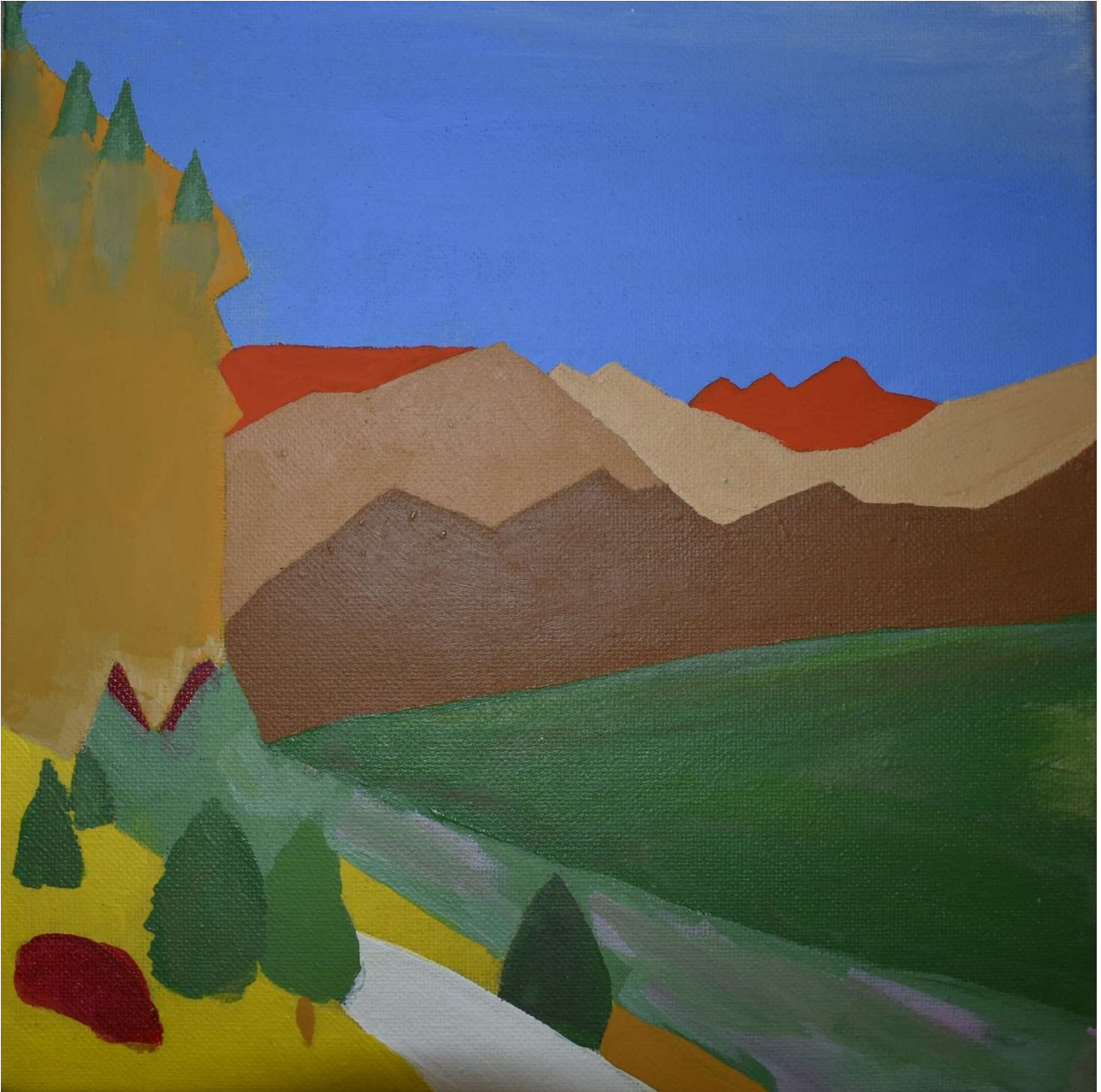
Die moderne Landschaft - Expressionismus, Bilge Özdemir, 12 LK BK